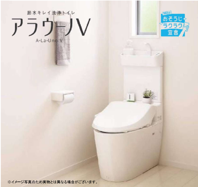
※イメージ写真のため実物とは異なる場合がございます。