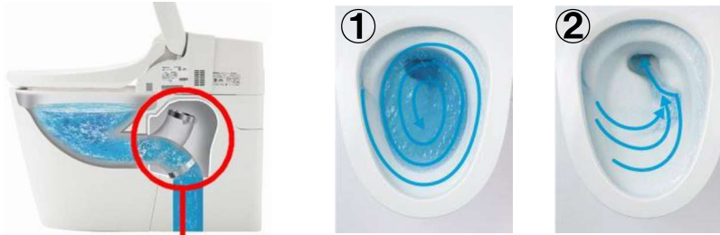
ターントラップ方式

排水路が上を向き、①ボールに水をためた状態で水を長時間巡回させ、②流れをコントロールして水を集め、勢いをつけて排水。 小洗浄3.0L、大洗浄4.6Lと、少ない水量での洗浄を実現しました。